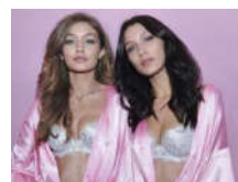
Bellezze Le sorelle Gigi e Bella Hadid, stelle delle passerelle