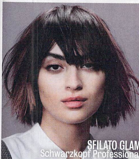
SFILATO GLAM Schwarzkopf Professional

1.EIMI, Dynamic Fix di Wella Professionals (€ 22,00): spray modellante per ciocche definite. Protegge i capelli da umidità, raggi Uv e calore e agisce in 45 secondi. 2.Thickening Conditioner di Revitalash Cosmetics (€ 39,00): aiuta a migliorare lo spessore dei capelli per una chioma piena e uno styling che dura a lungo. 3.Revamp di Cotril (€ 25,50): crema per lo styling dalla tenuta leggera per un controllo naturale; dona brillantezza, setosità e idrata le chiome.