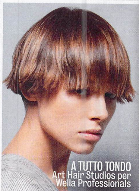
A TUTTO TONDO Art Hair Studios per Wella Professionals

4.wondHer, Prodigious Multi-tasking Hair Spray di Professional by Fama (€ 34,90): aiuta a ridurre l'effetto crespo agendo sulla porosità della fibra capillare per una chioma più lucente. Con estratto di girasole e proteine, si applica sui capelli umidi e non si risciacqua.