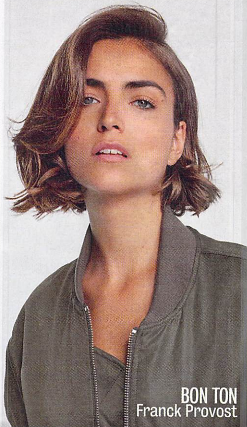
BON TON Franck Provost

G iocato su lunghezze diverse, il carré addolcisce la sua austerità grazie a un tocco d'artista come il ciuffo a onda che crea un effetto di morbidezza all'insieme di Franck Provost o le punte "pizzicate" e sollevate lungo il perimetro del taglio proposto da Art Hair Studios per Wella Professionals. Mentre un carré arrotondato si presta a essere lavorato con prodotti che danno corposità ai capelli, come nella proposta di Schwarzkopf Professional.