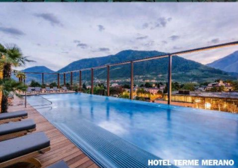
HOTEL TERME MERANO