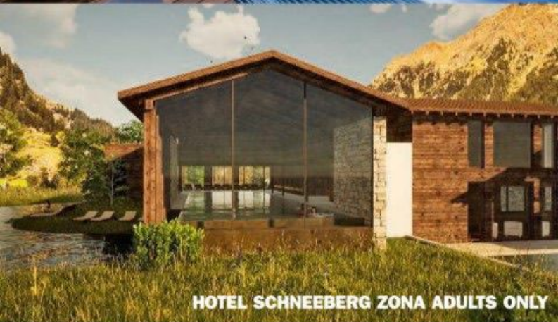
HOTEL SCHNEEBERG ZONA ADULTS ONLY