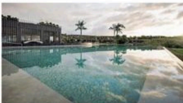
La piscina del resort Adler, ultimo nato in casa Sanremo e pronto Spa Med

A ppena varcato il cancello, il profumo di pino appena tagliato, le fragranze dell'arredo biologico e l'odore delle piante mediterranee sono inebrianti. La natura ti accoglie, nell'abbraccio azzurro di mare e coste bianche in cui è incastonato il nuovo resort Adler a Siculiana, tra due riserve naturali incontaminate. Quella della foce del fiume Platani e quella di Torre Salsa. Mare cristallino e spiaggia di sabbia finissima, falene di gesso color latte e murene calcaree, ma anche pini, eucalipti e acacie.