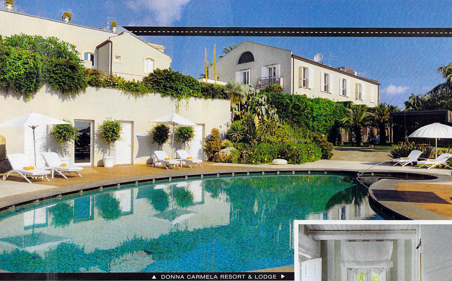
▲ DONNA CARMELA RESORT & LODGE ►