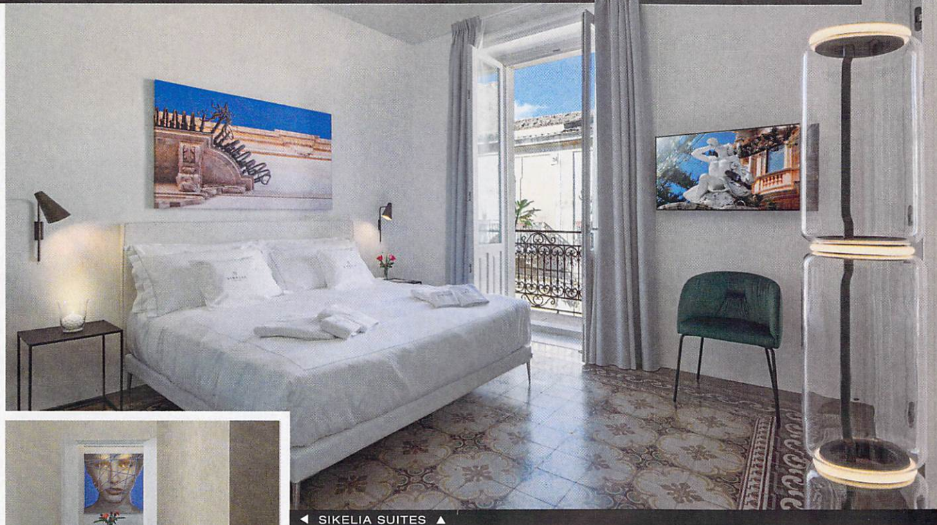
◀ SIKELIA SUITES ▶