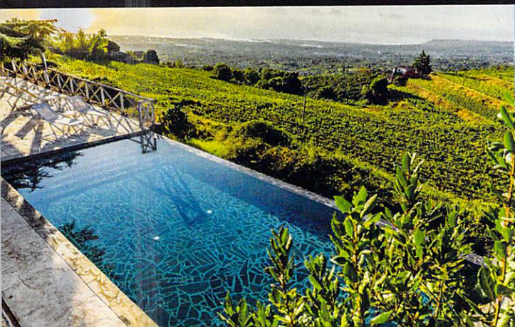
▼ BARONE DI VILLAGRANDE ▼

Siculiana (AG) Contrada Salsa ☎ 0922 1457000; adler-resorts.com