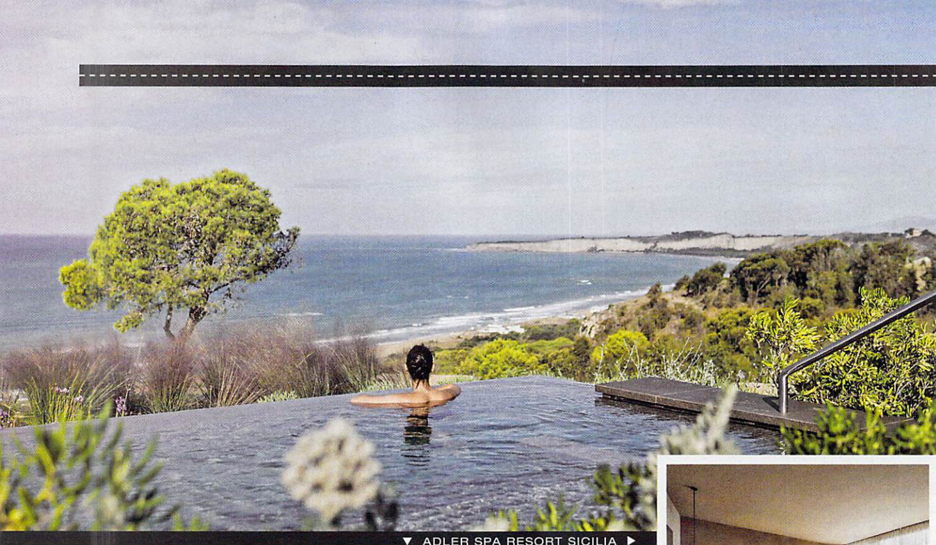
▼ ADLER SPA RESORT SICILIA ►

la tenuta e la piscina. Si trova a soli 11 chilometri da Modica, dove visitare il Duomo di San Giorgio, annunciato da una scenografica scalinata. Nel quartiere in basso si trovano la Chiesa di San Pietro, circondata dalle imponenti statue degli apostoli, e l'affascinante chiesa rupestre di San Nicolò Inferiore. Non dimenticate di fare scorta di cioccolato.