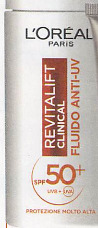
Fluido Anti-Uv Spf 50+ Revitalift Clinical di L'Oréal Paris (17,99 euro), antimacchie e antirughe, contiene vitamine C ed E e acido ialuronico.