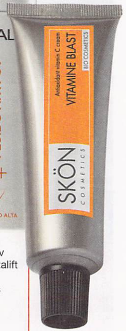
In pratico tubetto, Vitamine Blast Crema Bio alla Vitamina C di Skön (19 euro, su skoncosmetics.com ) illumina il viso e contrasta i segni dell'età.