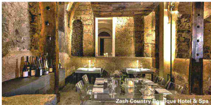
Zash Country Boutique Hotel &amp; Spa

INFO 091/804.88.00; grandhotel-et-des-palmes.com