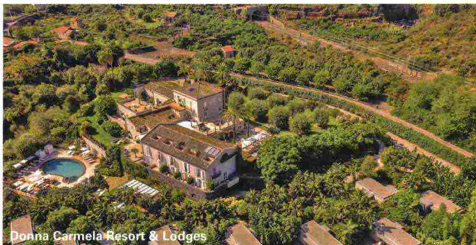
Donna Carmela Resort & Lodges