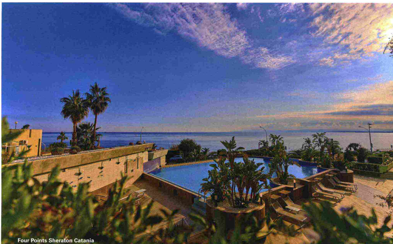
Four Points Sheraton Catania

di campagna della famiglia Cambria e quelli che un tempo erano i magazzini delle nocciole della tenuta agricola. Ogni stanza è un unicum per colore e forme, con mobili originali e rivestimenti in pietra naturale dal design minimalista. Un esempio di raffinata ospitalità siciliana che supera il concetto di wine resort; per chi soggiorna la parola d'ordine è autenticità, a partire dalla prima colazione a base di prodotti locali: formaggi etnei, salumi dei Nebrodi, marmellate, torte. Nel vecchio palmento, dai grandi muri in pietra lavica, si degustano invece le vecchie annate Cottanera. Doppia con colazione a partire da 180 €.