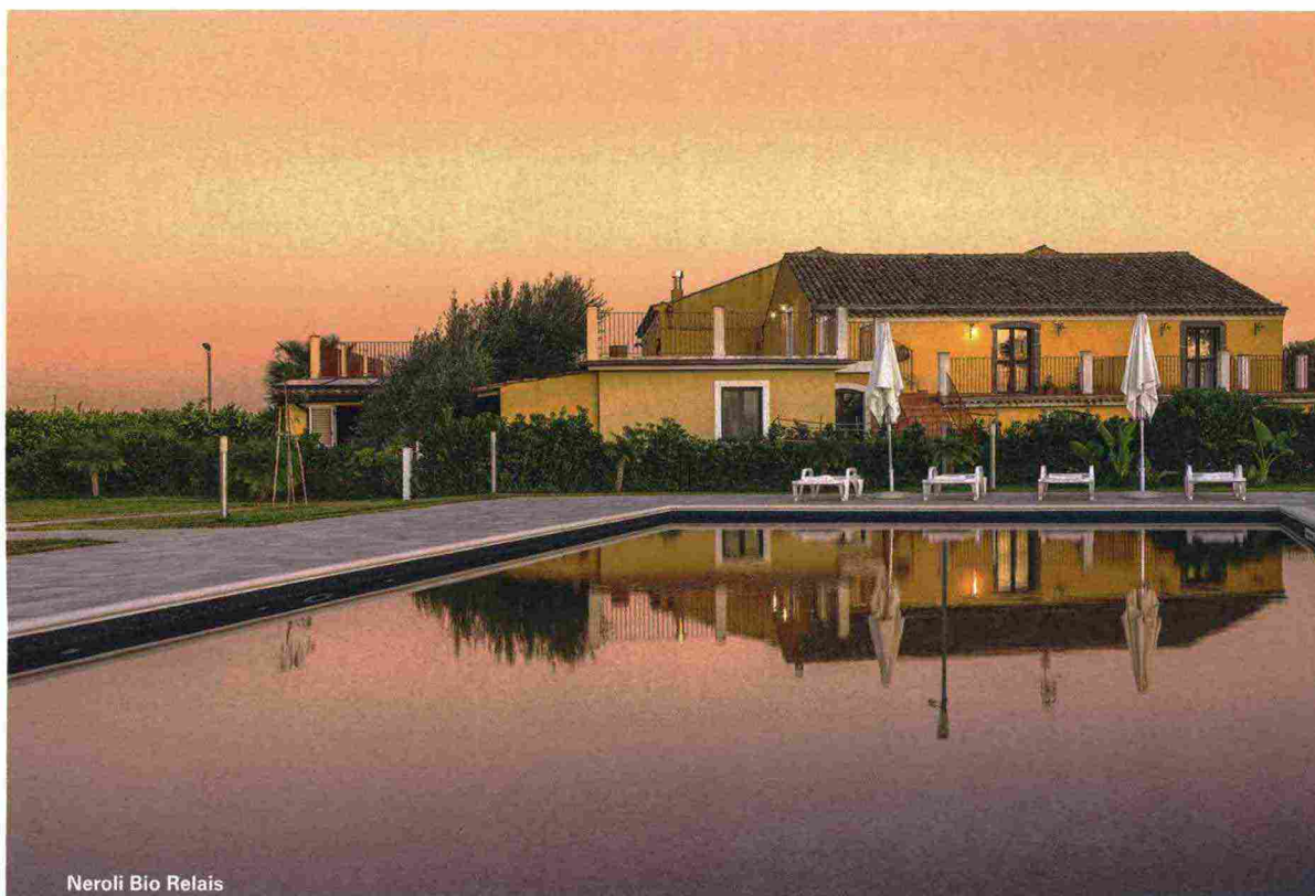
Neroli Bio Relais