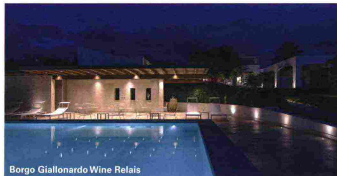
Borgo Giallonardo Wine Relais