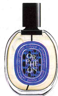
Eau de Parfum Orphéon di Diptyque (edizione limitata 75 ml, € 170).

Un balsamico che spalanca frontiere. Un distillato di volteggi aerei che trovano spazio nella memoria e si affollano fino a diventare un luogo da abitare saturo di luce sempre più maestosamente fiavole, fino a che giunge la notte e si dipana, universale. L'apertura è tutta emotiva con un saltellante, talcato e sinuoso muoversi di bacche di ginepro e poi un tripudio floreale, al mio olfatto vago quanto potente, «in movimento». Ecco la grazia sinuosa di un profumo tridimensionale e quelle frontiere a cui mi riferivo all'inizio. Orphéon si muove, e si muove carnale, ha un'elegante e materica fisicità ed ecco che sogno e realtà si mischiano come in una lullaby amorevole. E come sempre nelle più radicali scommesse, in questo caso vinta, è l'equilibrio degli opposti a imporsi: l'aspra e potente apertura del ginepro subito in amalgama con un floreale pacato e rassicurante (certo prevale il gelsomino, ma in un coro floreale molto vario) si adagia su un altrettanto rassicurante legno, stabile a chiudere con il corposo volume delle fave di tonka. Un profumo da vivere, da piccoli brividi erotici e viaggi in un altrove indefinito ma buono e protettivo. Di lunga persistenza, più adatto alla sera, e alla notte, e forse troppo speciale da essere sprecato indossandolo ogni giorno.