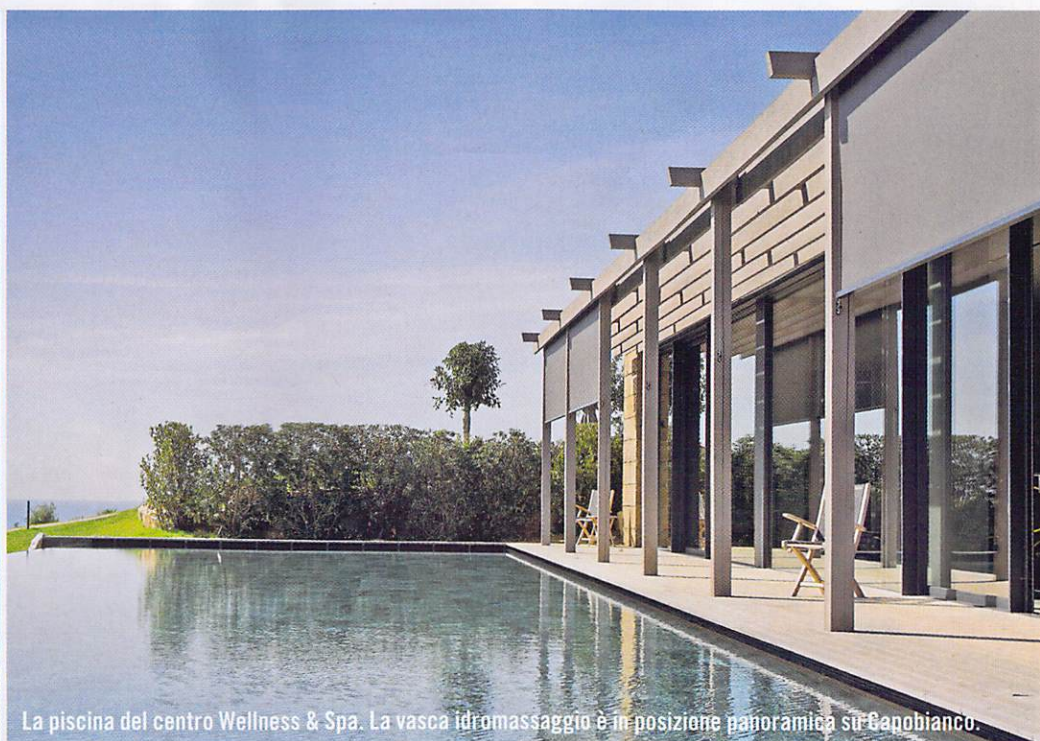
La piscina del centro Wellness & Spa. La vasca idromassaggio è in posizione panoramica su Capobianco.