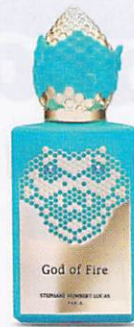
God of Fire di Stephane Humbert Lucas (50 ml, € 215).

La potenza del serpente di fuoco che s'inoltra sulla vostra pelle e si diffonde nell'aria, come in una foresta di suggestioni. Il nome di un profumo può essere quasi neutro o incredibilmente appropriato al proprio brand, dandone una forza non solo olfattiva ma anche concettuale: «Dio di fuoco». Iniziamo l'esperienza. Ed eccoci in una distesa di frutti, sotto un caldo tropicale: fragranze che esaltano subito. Poi il panorama si allarga, la fortissima nota introduttiva della danza tra la frutta diventa più briosa ma solida, e compare così la rassicurante fermezza dei toni legnosi, alberi ancorati alla Terra che tutto in questo profumo evoca. Principio vitale, invito all'armonia su un mondo estremamente vivace. Non è certo adatto a chi è troppo posato, troppo poco incline alle avventure (olfattive, ovviamente), ma se il viaggio avviene interiormente, apprezzando tutte le sorprese che questo profumo regala, possono certo provarlo pure loro, come dire, «in differita», come fosse un film che invece di essere visto viene annusato per tutto il tempo della sua durata. Quindi adatto a tutti. Rigorosamente unisex.